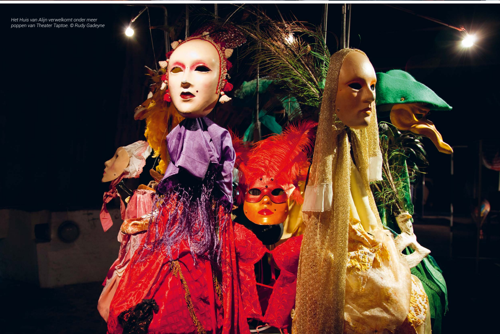
Het Huis van Alijn verwelkomt onder meer poppen van Theater Taptoe.