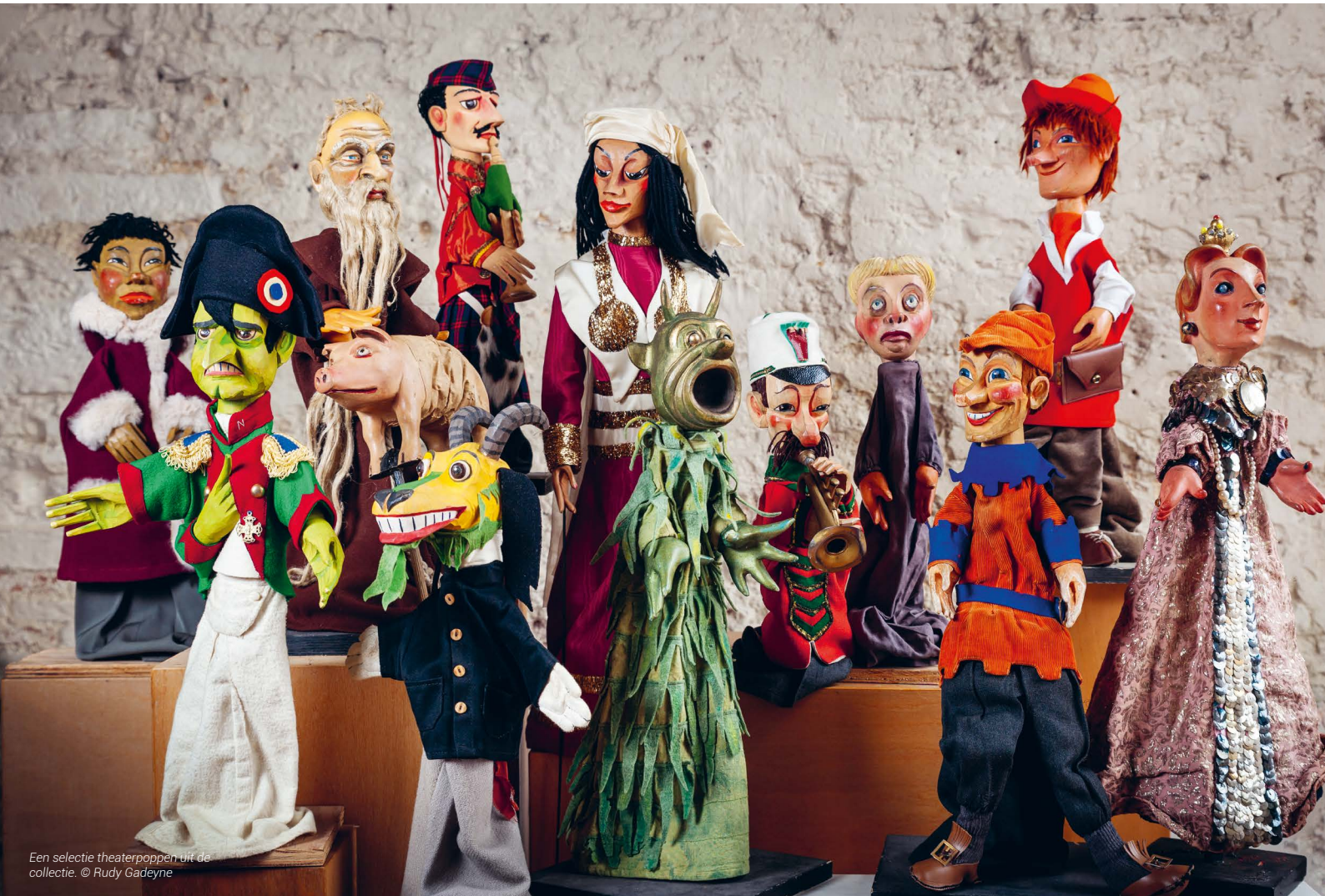
Een selectie theaterpoppen uit de collectie.