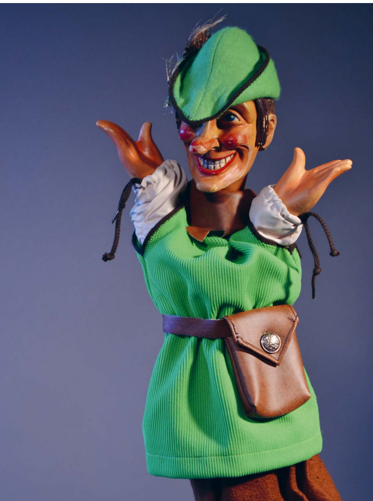
Het Museum Hof van Busleyden is voortaan de trotse eigenaar van de Mechelse superheld Tijl uit Tijl Uilenspiegel van Hopla (eind jaren 1950). © Rudy Gadeyne